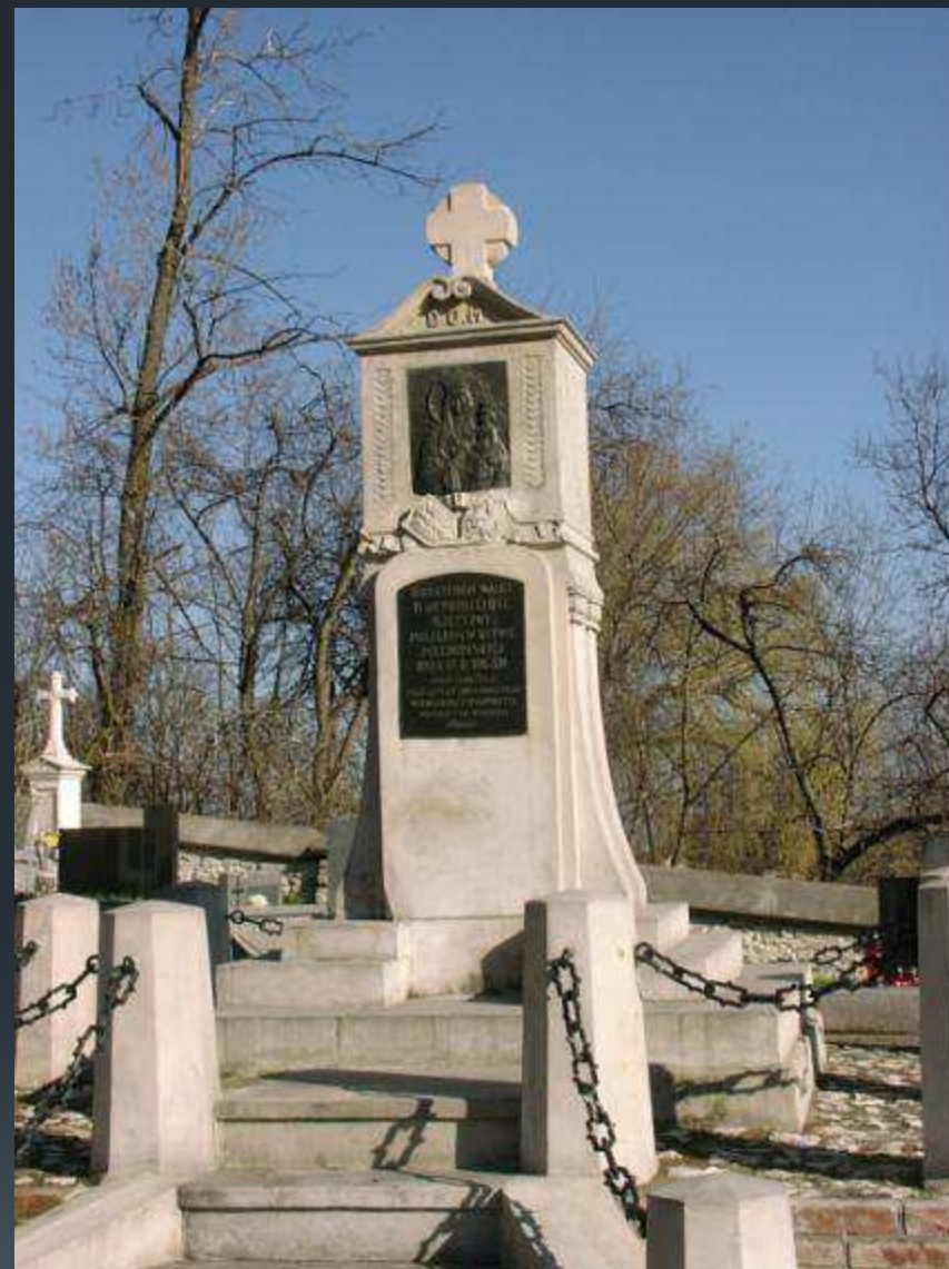
Pomnik na mogile powstańców - cmentarz parafialny w Miechowie