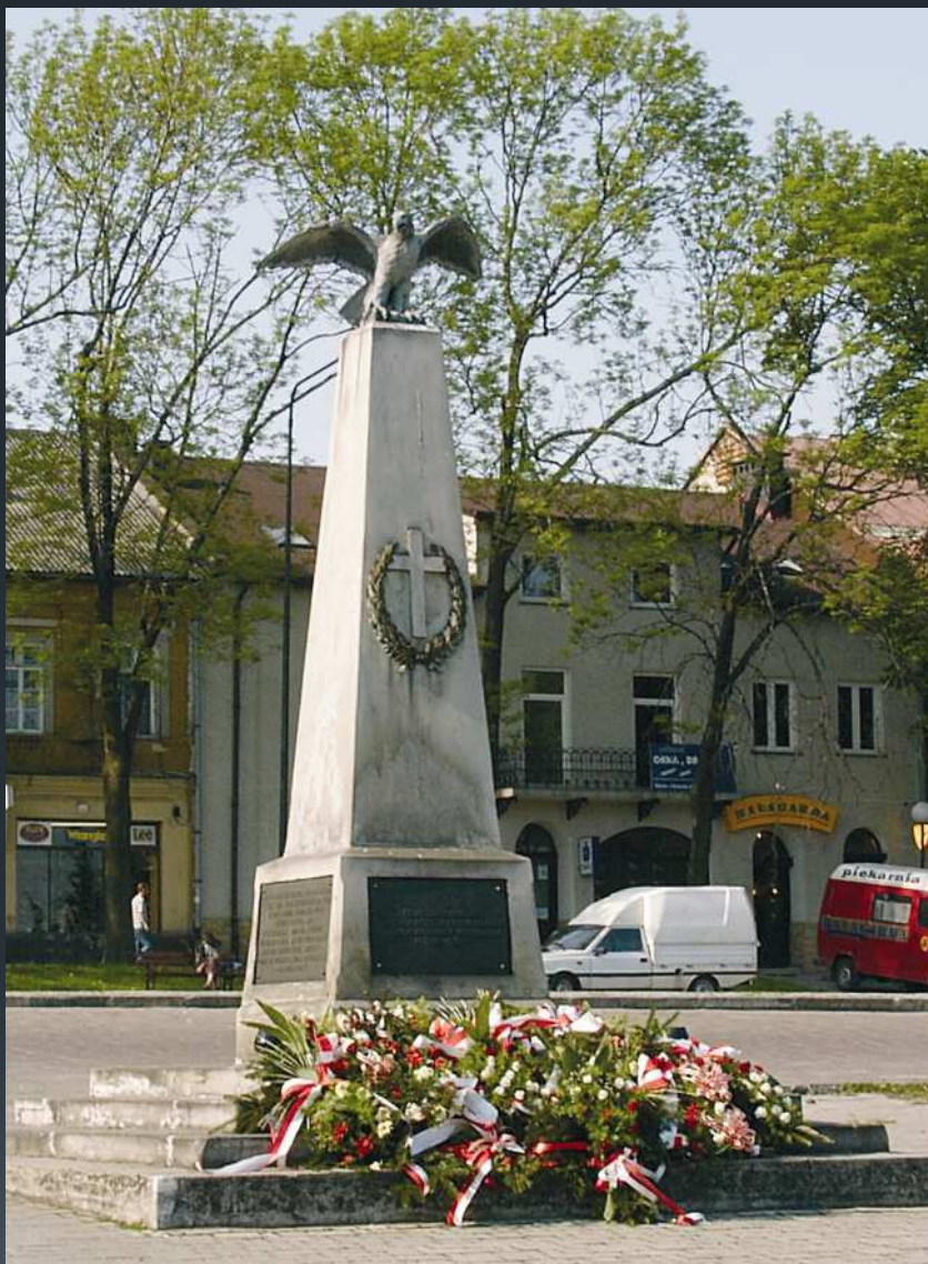
Pomnik w Rynku miechowskim ustawiony na miejscu studni do której wrzucano rannych i zabitych